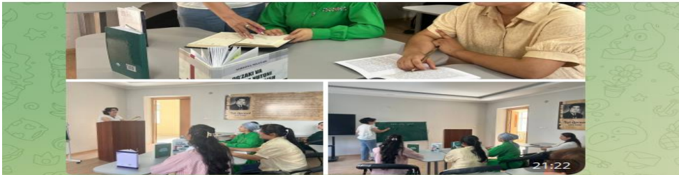
"Ёш тилшунослар" тўрагагининг навбатдаги дарс жараени