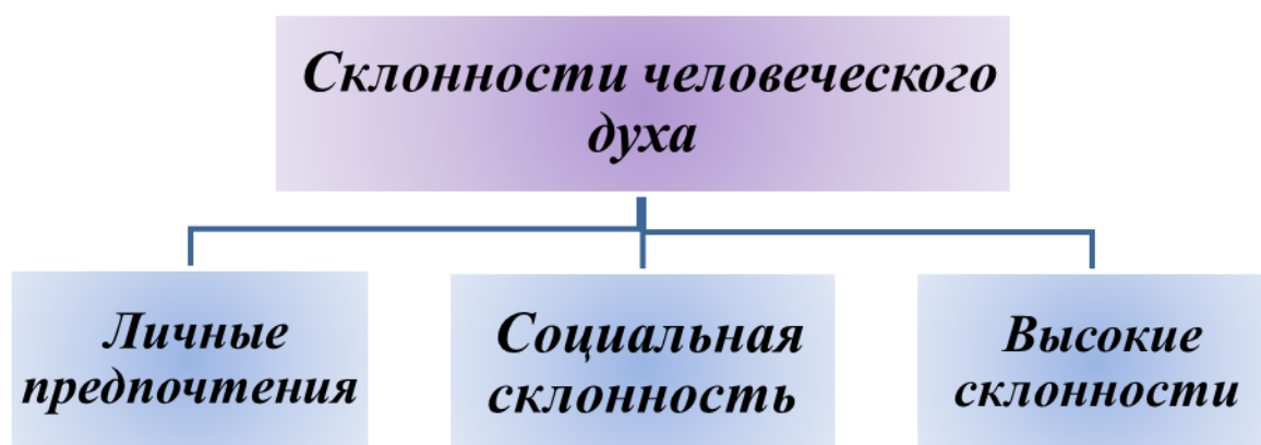
Рис.1.1. Склонности человеческой души

В концепции нравственного воспитания Абдурауфа Фитрата особое внимание уделяется классификации и описанию нравственных склонностей, а наклонности человеческой души делятся на три части: личные, общественные и высшие наклонности 19 . (См.: рис.1.1)