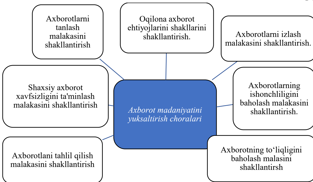
1-rasm. Axborot madaniyatini yuksaltirish choralari