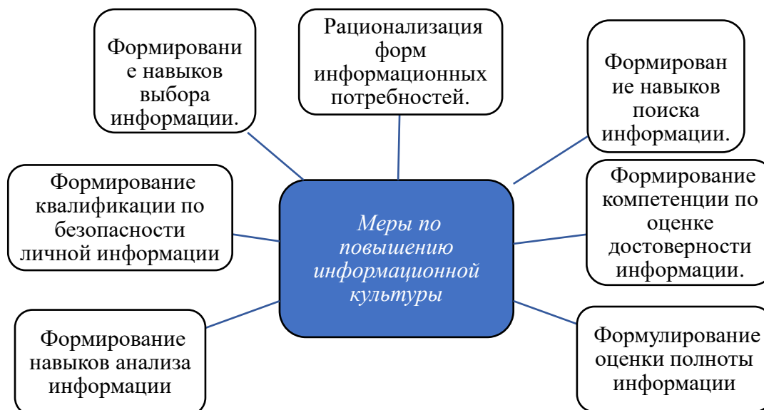
Рисунок 1. Меры повышения информационной культуры

По мнению исследователя, для повышения информационной культуры человека, прежде всего, необходимо сформировать его рациональные информационные потребности. Человек начинает правильно использовать ресурсы Интернета только тогда, когда у него возникают информационные потребности, которые служат духовному росту. В результате, Интернет-пространство становится ресурсом, обеспечивающим его положительную социализацию, доносящим гуманные знания, нормы и ценности. Пока информационные потребности не приобретут рациональный характер, человек будет продолжать находиться под влиянием негативной информации. Поэтому в век информации необходимо уделять серьезное внимание формированию разумных информационных потребностей членов общества, не ограничиваясь развитием источников ее получения.