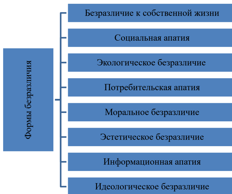
Рис.1. Формы проявления безразличия

Во всех странах мира за последние полвека увеличилось число равнодушных людей. Более того, к началу нового столетия безразличие людей начало проявляться в различных формах. На основании этой информации исследователь классифицировал формы безразличия следующим образом: (См. Рис.1)