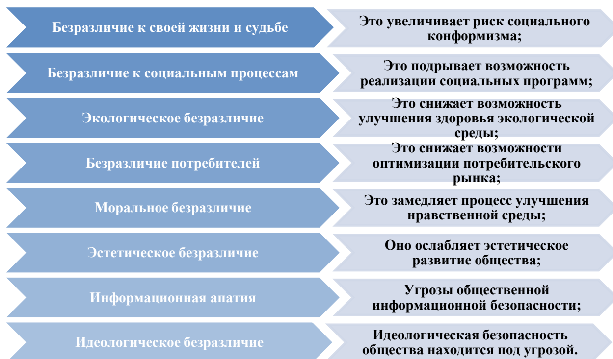
Рис.2. Социальные последствия форм безразличия

В диссертации, основанной на анализе научных источников, ряда фактов и сведений, статистических цифр, представленных в средствах массовой информации, констатируется, что проявления безразличия в различных формах в Узбекистане уже имеют серьезные последствия для общества и для равнодушного человека. подчеркнул. Он выразил социальные последствия форм безразличия следующим образом: (См. Рис.2)