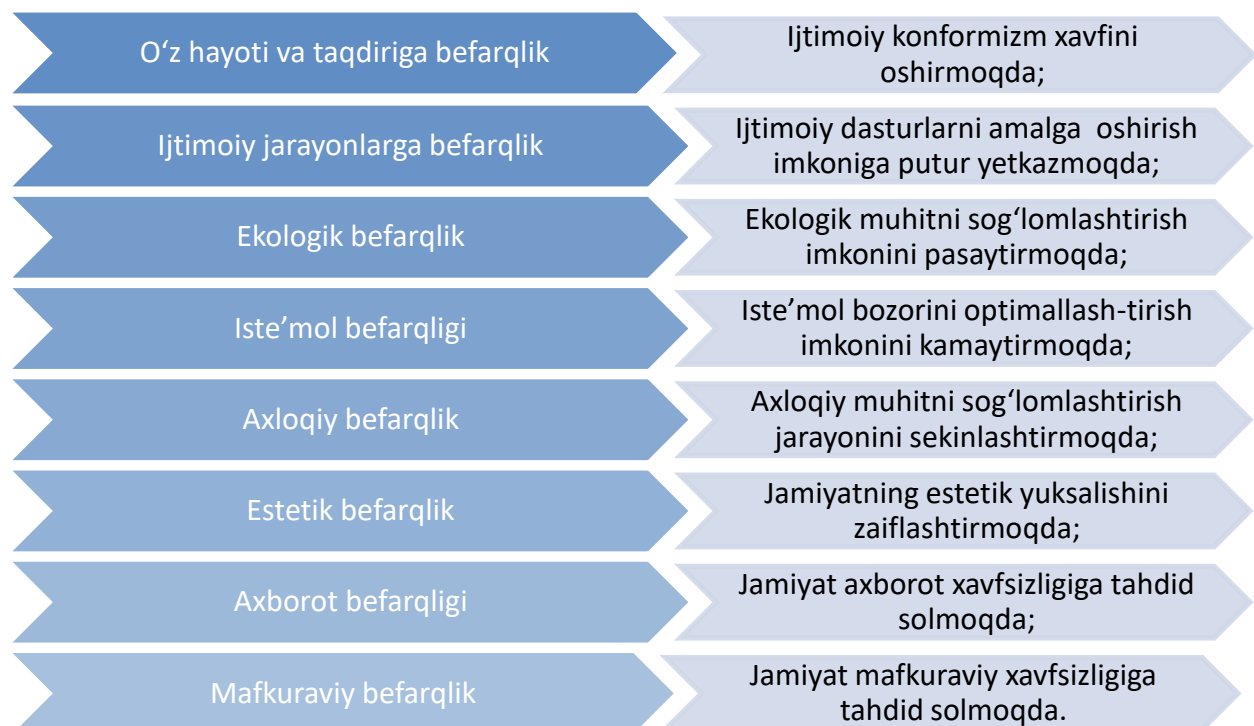
2-rasm. Befarqlik shakllarining ijtimoiy oqibatlari

Dissertant ilmiy manbalar tahlili asosida ommaviy axborot vositalarida ma’lum qilinayotgan qator fakt va ma’lumotlar, statistik raqamlar O‘zbekistonda yuz ko‘rsatayotgan turli shakllardagi befarqlik alomatlari bugunning o‘zidayoq jamiyat uchun ham, befarq shaxs uchun ham jiddiy oqibatlariga olib kelayotganini ta’kidlagan. Befarqlik shakllarining ijtimoiy oqibatlarini quyidagicha ifodalagan: (Qarang: 2-rasm)