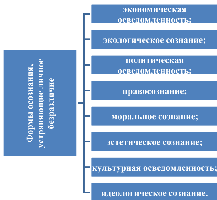
Рис. 3. Формы осознания, устрояющие личное безразличие

В диссертации обосновывается необходимость повышения уровня следующих форм осознания с целью устранения личностного безразличия: (См. Рис.3)