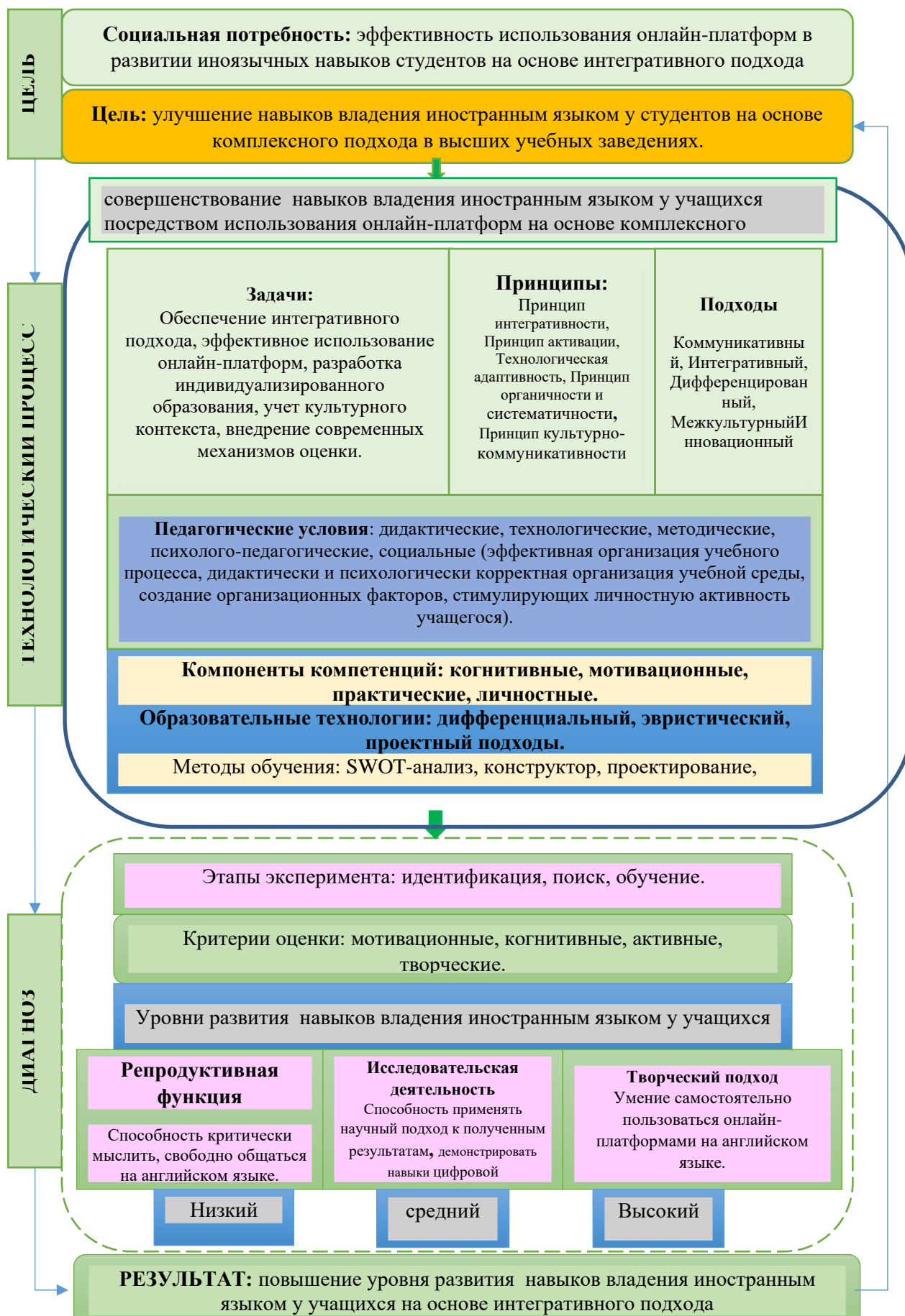
Рисунок 2.2.1. Педагогическая модель процесса обучения, описывающая методологию использования онлайн-платформ для развития у студентов навыков владения