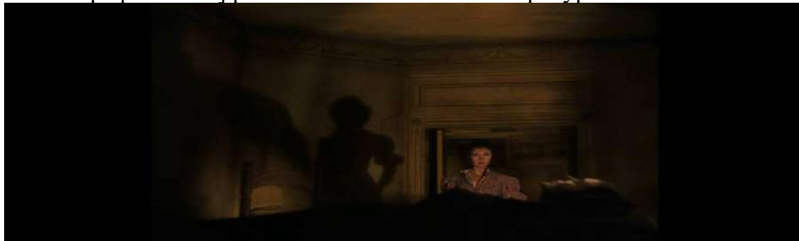
Рисунок 1.3. Фрагмент из фильма « Gone with the wind ».

а. Трехкомпонентная комбинаторная модель включает в себя различные конфигурационные схемы [вербальные + невербальные + кинематографические] различных семиотических ресурсов.