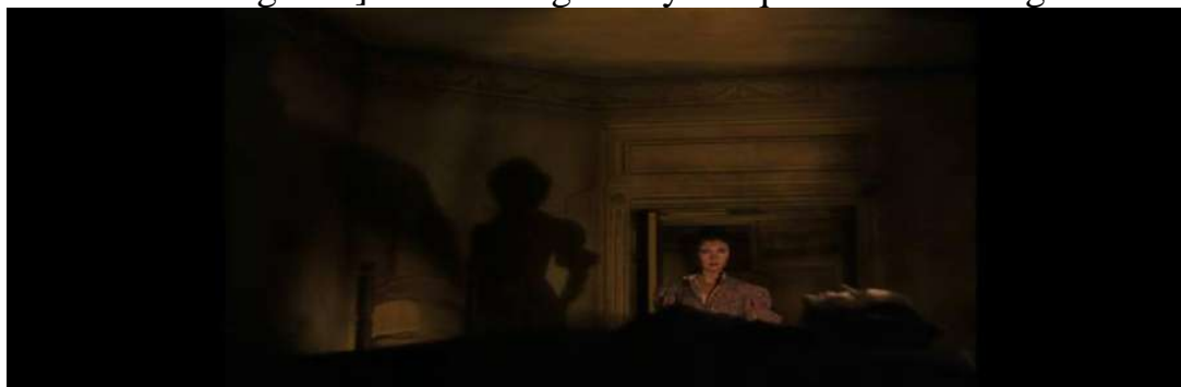
1.3-rasm. “Gone with the wind” filmidan olingan parcha.

a. Uch komponentli kombinatorik model turli semiotik resurslarning [verbal + noverbal + kinematografik] turfa konfiguratsiya naqshlarini oʻz ichiga oladi.