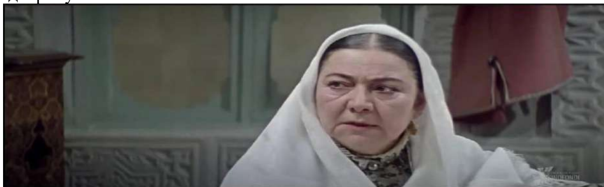
Рисунок 1.4. Фрагмент из фильма «Минувшие дни».

• Уголки и движение камеры: Камера, вероятно, использует низкий угол, когда Скарлетт поднимает кулак, что увеличивает ее ощущение сопротивления и силы. Движение камеры может быть статичным, чтобы подчеркнуть тяжесть его клятвы.