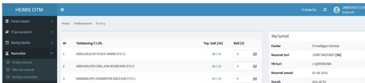
2-расм. Фаннинг жорий назорат балини кўриш

Жорий назорат натижаларини кўриш учун назоратлар рўйхатининг Guruh устунидан жорий назорат тури бўйича гурухни танланг. Натижада экранда қуйидагича ойна пайдо бўлади (2-расм).